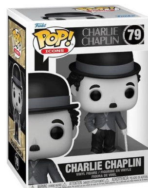
チャップリン 海外ライセンス商品例